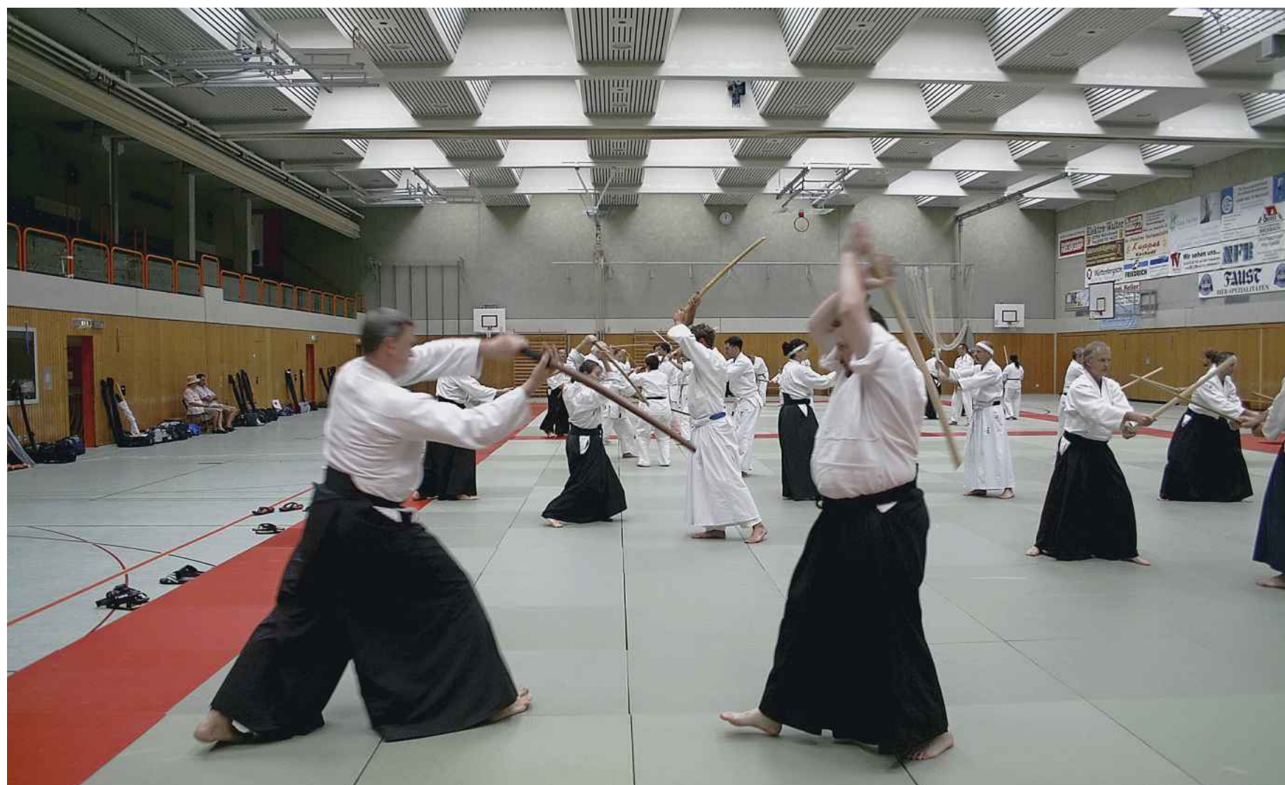
Ursprünglich als Schwertersatz im Training entwickelt, gehört der Bokken zur Standardausrüstung eines jeden Aikidoka. Den schwarzen Hosenrock, Teil der klassischen Samurai-Kleidung, müssen die Schwarzgurtträger auch im Training anlegen. Bis zum ersten Dan benutzen die Aikidokämpfer einen Judo-Anzug.

Heinz Piotrowski, Hauptstraße 13, Kirschfurt